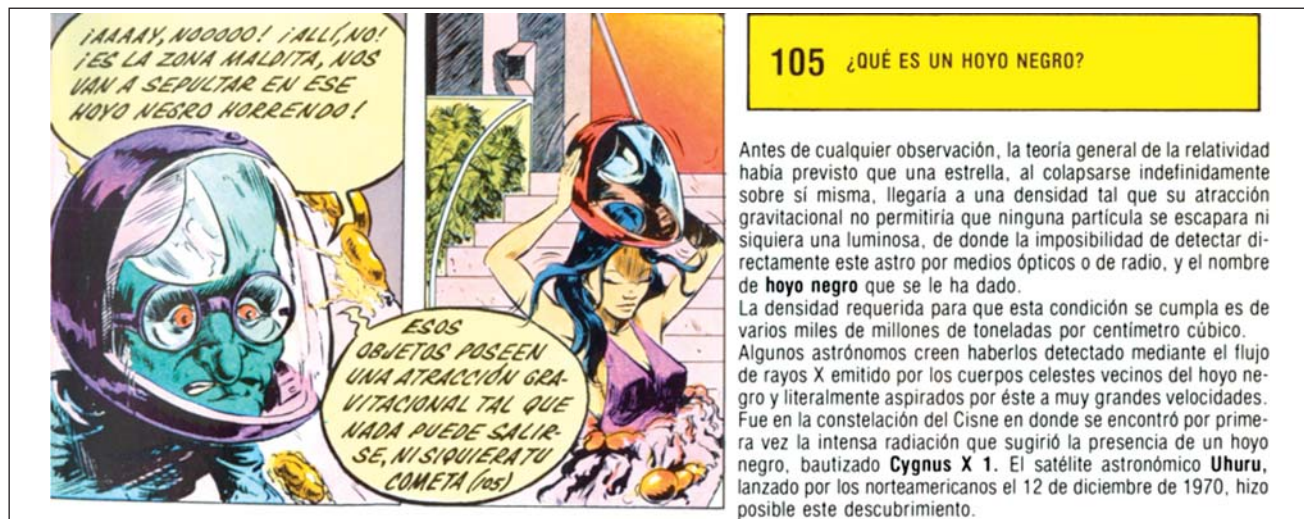
Figura 1. Viñeta de Le monde des connaissances, L'encyclopédie en bandes dessinées (Enciclopedia Científica Proteo). En la imagen puede apreciarse cómo uno de los personajes hace referencia a los hoyos negros. El texto en la parte derecha (apéndice) explica con mayor detalle el concepto.

Su contenido, dividido en dos partes, tenía un cómic relacionado con un apéndice donde se explicaban los temas científicos.