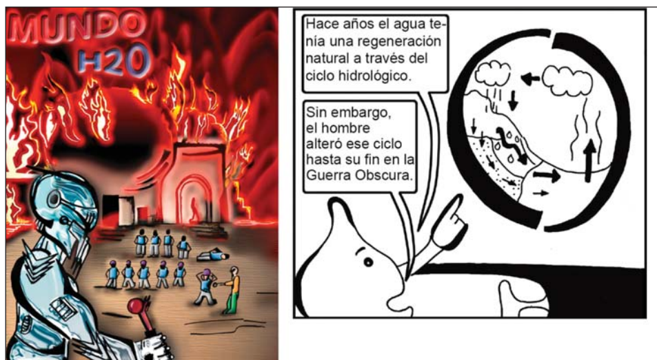
Figura 3. Portada de Mundo H 2 O y viñeta del ciclo hidrológico donde se aprecia a Ploppy, la gotita.