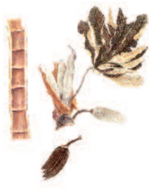
Cecropia obtusifolia , ejemplar de guarumbo del Herbario Medicinal del IMSS. Acuarela de Héctor Cruz Tejeda, 2001.

Sin que se sepa el origen médico-histórico, el nopal se usaba contra la diabetes