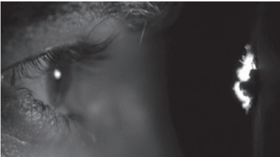
Figura 1. Norman espía. Psicosis , 1960, Alfred Hitchcock.

bilidades en las que derivaría la historia del robo o su huida mientras la noche y la lluvia caen. De repente, algo cambia: cesa la música, escuchamos la lluvia y el compás de los limpiaparabrisas, y aparece el anuncio: “Bates Motel. Vacancy”. Aquí se abre otra posibilidad: ella pasará la noche en un motel. Esto es suspenso: la motivación para ver la sucesión de planteamientos de la historia como partes orgánicas de una larga secuencia. Veremos que Norman Bates espía a Marion, mientras ella se desviste. Lo que sigue es parte de la historia del cine.