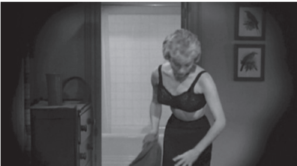
Figura 2. Marion lo ignora. Psicosis , 1960, Alfred Hitchcock.

El suspense se orienta al resultado si genera una ansiedad encaminada al qué sucederá, o bien se orienta al proceso si provoca interés en cómo sucederán los eventos