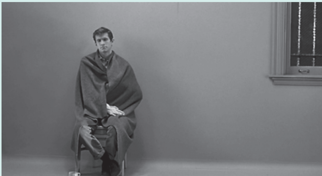
Figura 3. ¿Final abierto? Psicosis , 1960, Alfred Hitchcock.

Toda organización suspensiva de una historia requiere primero de una apertura, luego de una expansión y posteriormente del cierre de lo planteado. Ésta es la estructura básica. Si un filme termina por concederle al lector la posibilidad de decidir la conclusión, siempre tentativa, de lo sucedido, se considera de final abierto . Esta apertura debe ser resultado de una meditación inteligente dado lo pasado.