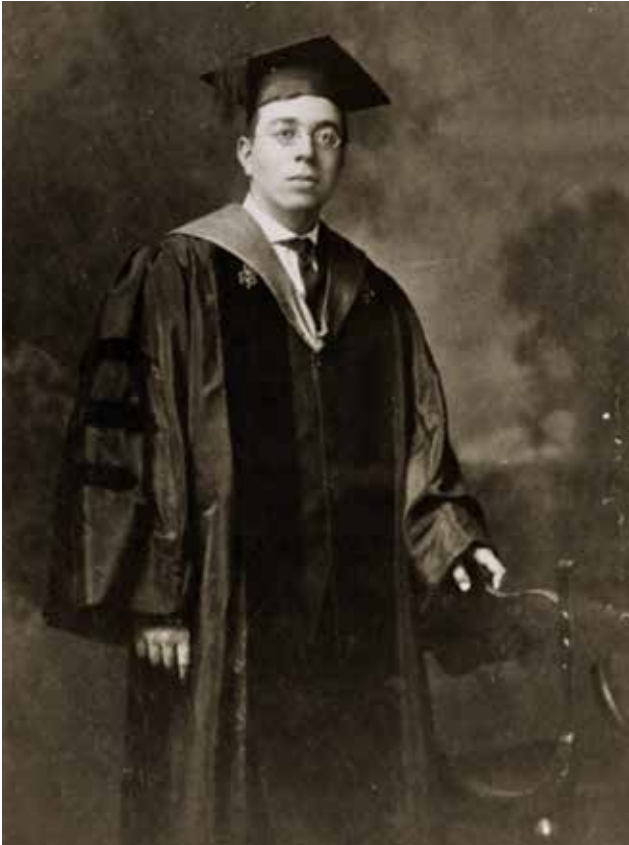
Figura 4. Norbert Wiener al graduarse de Harvard.