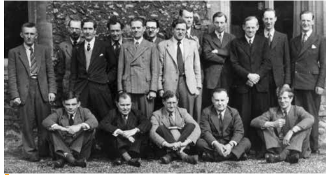
Figura 8. The Ratio Club, 1952.

Hacia finales de los años 40 y principios de los 50 del siglo XX, la cibernética tuvo un gran auge. En 1950 los franceses crearon el Cercle d'Études Cybernétiques (Círculo de Estudios Cibernéticos), que fue la primera asociación científica de su tipo en el mundo. En Italia, Enrico Fermi promovió en 1954 la creación de un seminario sobre cibernética en la Universidad de Roma, y en 1957 se estableció la División de Cibernética en