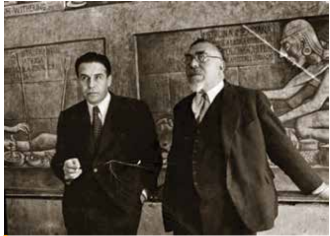
Figura 6. Arturo Rosenblueth y Norbert Wiener en la Ciudad de México.

Durante la década de 1930, Wiener construyó buena parte de los fundamentos de su nueva teoría de las comunicaciones. Además de dos libros, publicó 40 artículos durante estos años. Pero en 1940, con el advenimiento de la Segunda Guerra Mundial y la participación de Estados Unidos en ella, Wiener tuvo que posponer sus muchos proyectos para colaborar con su país. Eligió trabajar en un tema muy desafiante: el diseño del sistema de control de la artillería antiaérea. Los aviones eran ya más sofisticados y resultaba muy difícil para un humano poder apuntarles, por lo que el problema a resolver era uno de predicción (la posición actual de un avión enemigo podía determinarse por medio de un radar, pero debía predecirse su trayectoria futura para poder derribarlo). Wiener propuso un modelo estadístico que permitiera maximizar la probabilidad de éxito de la artillería antiaérea. Un problema fundamental de su modelo fue que si se intenta controlar la acción de un arma siguiendo con mucha fide-