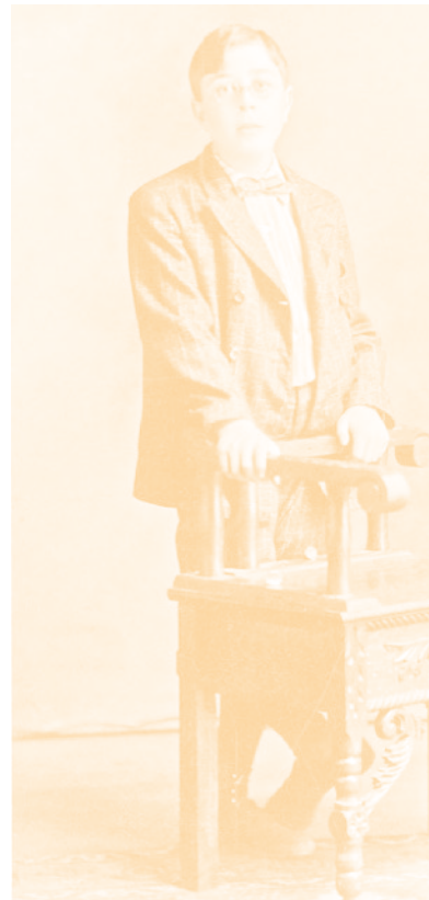
Figura 3. Norbert Wiener al graduarse de la preparatoria.

A los diez años de edad escribió su primer ensayo filosófico, titulado “La teoría de la ignorancia”, el cual versaba sobre la incompletez de todo el conocimiento