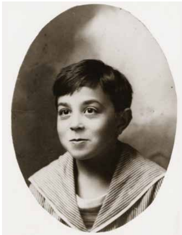
Figura 2. Norbert Wiener a los siete años de edad.