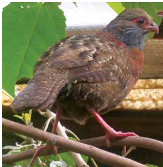
Figura 4. La chivizcoya D. barbatus (en cautiverio).

tan cauteloso y esquivo ante un potencial peligro ha complicado la tarea de los naturalistas y ornitólogos a lo largo de la historia para estudiarlas y conocerlas; al no tener un contacto visual directo con estas aves, los interesados han especulado mucho y generado (o perpetuado) información dudosa, desconocimiento y mitos en torno a temas como su clasificación taxonómica, el tamaño de su área de distribución y su estatus de riesgo o amenaza. Aquí expongo algunas de las situaciones más controvertidas que involucran a estas gallinas de monte; la prevalencia en el terreno de la imaginación ha sido determinante para sesgar o frenar el avance en el conocimiento y la conservación de estas aves.