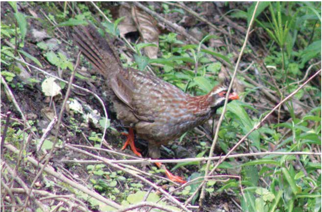
Figura 5. La perdiz de cola larga, D. macroura .

Por otro lado, la perdiz de cola larga y la perdiz centroamericana se encuentran en la categoría internacional de “menor preocupación”, debido a su aparentemente amplia área de distribución. Sin embargo, es necesario mencionar que el área de distribución de ambas perdices es discontinua; es decir, se reconoce un archipiélago de cimas de sierras donde existe su hábitat adecuado, por lo que es posible que sus poblaciones estén aisladas y no se reproduzcan entre sí. Este aislamiento ha dado origen