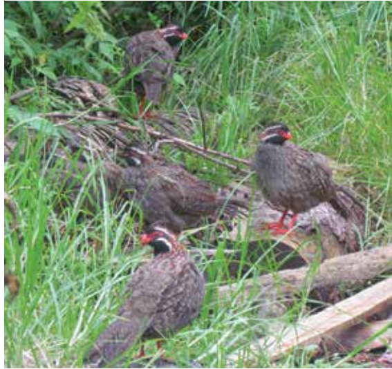
Figura 2. La perdiz de cola larga, D. macroura (Foto: P. Parra Noguez).