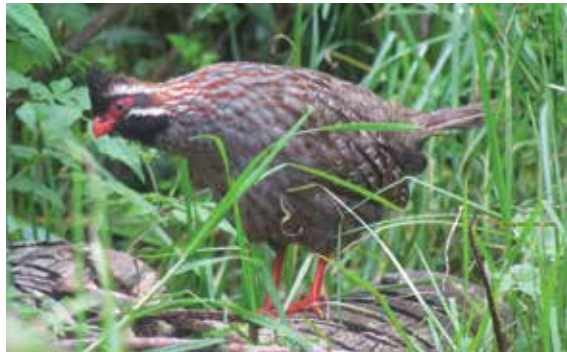
Figura 3. Una parvada de la perdiz de cola larga, D. macroura.