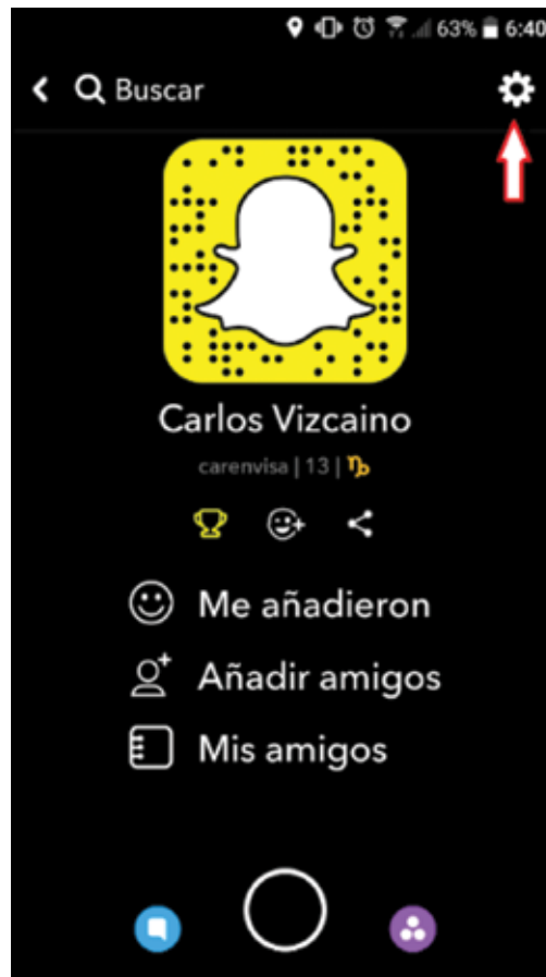
Figura 3. Página de inicio de tu cuenta de Snapchat.

En la página de inicio de tu cuenta de Snapchat (véase la Figura 3), al hacer clic en el engrane (o