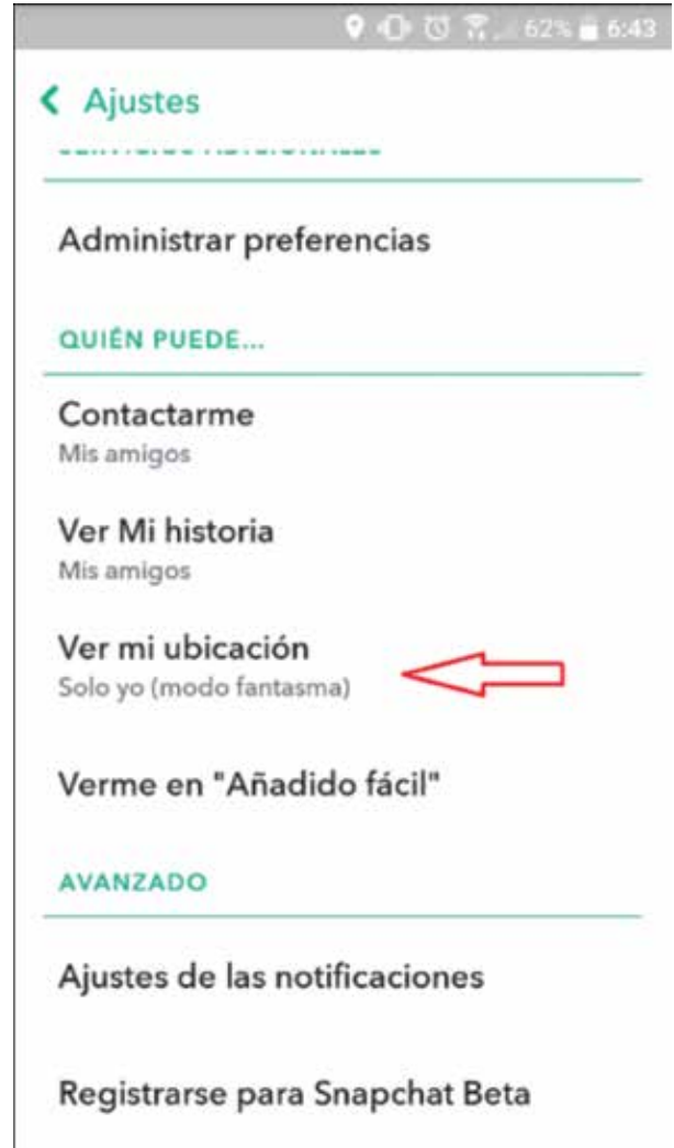
Figura 4. Panel de configuración o ajustes de tu cuenta de Snapchat.

En este trabajo mostramos sólo algunas herramientas que son muy utilizadas y prácticas para los casos de emergencias. Ahora bien, como no sabemos en qué momento ocurrirá un sismo u otro fenómeno natural o provocado por los humanos que pueda afectarnos, debemos saber cómo compartir nuestra ubicación de manera permanente o inmediatamente después de que hemos sido afectados. También es recomendable compartir tu ubicación siempre que salgas de viaje, vayas a una fiesta, tengas que visitar lugares inseguros, cuando salgas tarde del trabajo o de una reunión, etcétera.