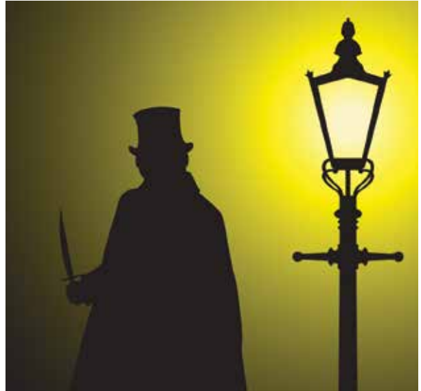
Jack el Destripador.