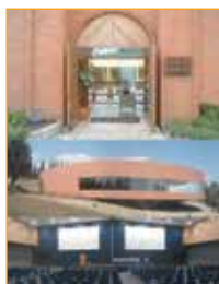
Separador: Academia Mexicana de Ciencias.

Este número de la revista Ciencia ha sido posible gracias al patrocinio de la Universidad Autónoma Metropolitana.