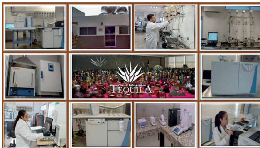
Figura 1. Infraestructura del Laboratorio de Isotopía del Consejo Regulador del Tequila.

Antes de referir los avances alcanzados en el Laboratorio de Isotopía del CRT, es importante explicar qué es un isótopo. De acuerdo con el Organismo Internacional de Energía Atómica (OIEA), un isótopo se defi-