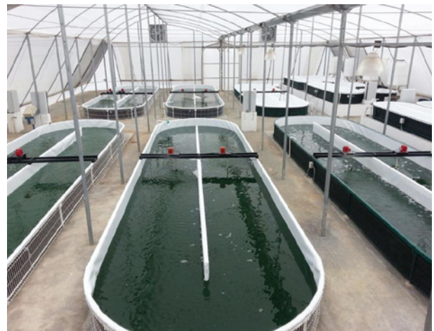
Figura 2. Producción a escala en raceway . Reactores tipo raceway para producción industrial de microalgas. En la imagen se muestra la producción de Spirulina en invernadero en la empresa Biomex.