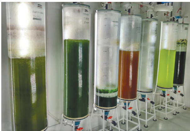
Figura 1. Reactores 80 L. Reactores para producción en escala piloto de diversas microalgas, como Spirulina , Phaeodactylum y Haematococcus .

Desde hace algunos años se ha reconocido el valor nutricional de las algas microscópicas debido a que contienen compuestos químicos de origen vegetal (fitoquímicos), carotenoides y otros antioxidantes similares a los de los vegetales verdes y amarillos, cuya ingesta es benéfica para la salud. De las microalgas se pueden obtener espesantes como carragenina y agar; colorantes y antioxidantes, tales como astaxantina (colorante rojo), betacaroteno (colorante amarillo/naranja), clorofila (colorante verde) y ficocianinas (colorante azul), entre muchos otros; así como también ácidos grasos, sobre todo los omega-3.